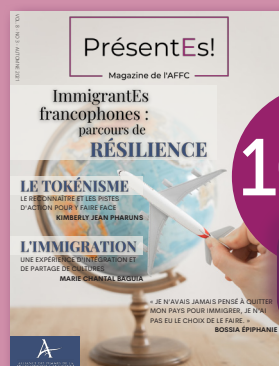
ImmigrantEs francophones : parcours de résilience