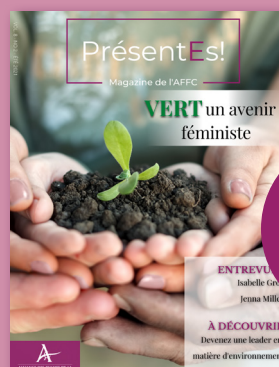
Vert un avenir féministe