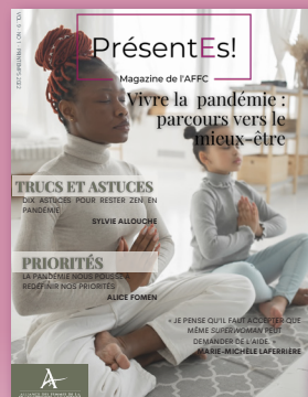
Vivre la pandémie : parcours vers le mieux-être