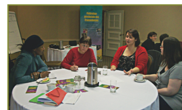
Session de planification en février 2013 à Saskatoon.

Enfin, pour fêter à notre façon l'Année des Fransaskois, la FPF a misé sur la valorisation de l'apport des femmes dans la gouvernance de la Fransaskoisie et ce, dans le Shack des Femmes lors de la Fête Fransaskoise. Une exposition de photos et de textes mettant en vedette des « femmes remarquables » et des leaders communautaires, a meublé les murs du Shack tandis que des représentations par des femmes artistes divertissaient les visiteurs. Le Shack des Femmes est devenu un incontournable lors de la Fête Fransaskoise et la FPF s'efforce d'y offrir une programmation renouvelée à chaque année.