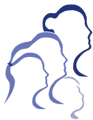
Fédération des femmes acadiennes de la Nouvelle-Écosse

La Fédération des Femmes acadiennes de la Nouvelle-Écosse (FFANE) a choisi pour sa 29 e année le thème « Nous écoutons, vous partagez, elles agissent ».