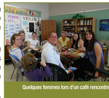
Quelques femmes lors d'un café rencontre

Nous avons publié « Entre amies » 5 fois en plus de fournir des articles pour « Franc copain », journal de l'Association francophone. Une liste de distribution et une page sur Facebook nous permettent de faire connaître davantage nos activités.