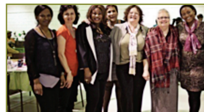
Célébration avec les femmes nouvelles arrivantes

La nouvelle année financière a reconnecté l'organisme à ses priorités définies à travers son plan stratégique 2012 qui tournent autour des questions qui aggravent la pauvreté chez les femmes et dans nos communautés. Nous nous soucions de la pénurie des services de garde en milieu francophone. Nous travaillons avec plusieurs partenaires pour discuter des enjeux pour les familles francophones. Nous nous préoccupons du coût d'hébergement au Manitoba, des services en langue française pour la ligne de crise et des tarifs de transport public sans cesse en hausse. Nous sommes membres de fédérations des conseils de femmes et nous faisons valoir les besoins de la communauté francophone. Nous entretenons des partenariats avec la Maison Gabrielle Roy, le Directeurat de l'activité sportive, l'Accueil francophone, le CCFM, le CJP, la FAFM, la SFM, le CDEM, la FPM, Envol 91, La Liberté, L'USB, Caisse groupe financier, Francfonds, le Conseil de planification sociale de Winnipeg, la Child Care Coalition of Manitoba, parmi d'autres. Nous appuyons les activités de Pluri-Elles, de l'Amicale de la francophonie. Nous avons une communauté dynamique et nous voulons nous assurer que ses besoins sont à l'ordre du jour des instances gouvernementales.