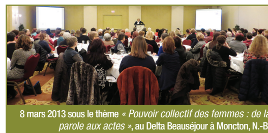
8 mars 2013 sous le thème « Pouvoir collectif des femmes : de la parole aux actes », au Delta Beauséjour à Moncton, N.-B.

Finalement, le RFNB organise un Sommet des femmes dans le cadre du Congrès mondial acadien 2014. Sous le thème « Partout les femmes décident... les femmes agissent! », le Sommet aura lieu du 17 au 19 août 2014 à Edmundston au N.-B. Prenez-en note !