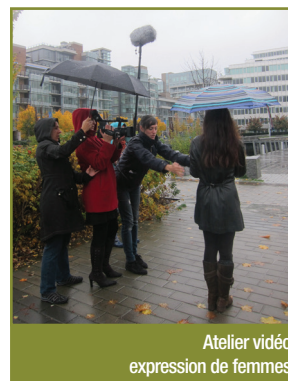
Atelier vidéo expression de femmes

En conclusion, RFCB a continué à s'impliquer dans la communauté de Colombie-Britannique en participant à divers comités et en créant une dizaine de partenariats.