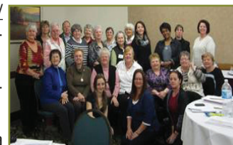
Groupe qui a offert, en région, l'atelier « Veiller au bien-être des aidantes »

Sans compter la participation aux nombreux comités ainsi que les multiples collaborations, l'année aura été aussi remplie qu'à l'habitude.